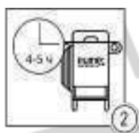
Шаг 2 - Очистка системы с элиминайтором®